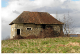
La Bâtie-Divisin p. 62 à 65