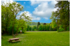
Massieu p. 82 à 87