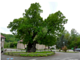
Réaumont p. 126 à 129