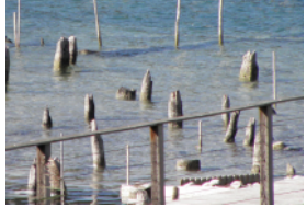
Charavines p. 30 à 37