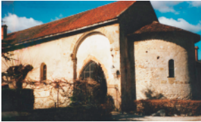
Chirens p. 42 à 52