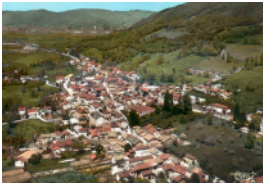
La Murette p. 74 à 77