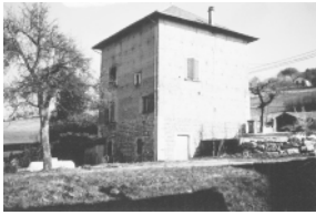
Bilieu p. 22 à 25