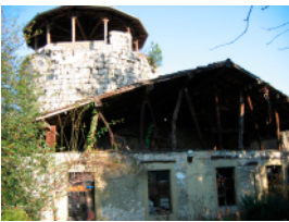
Moirans p. 96 à 106