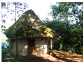
Paladru p. 114 à 119